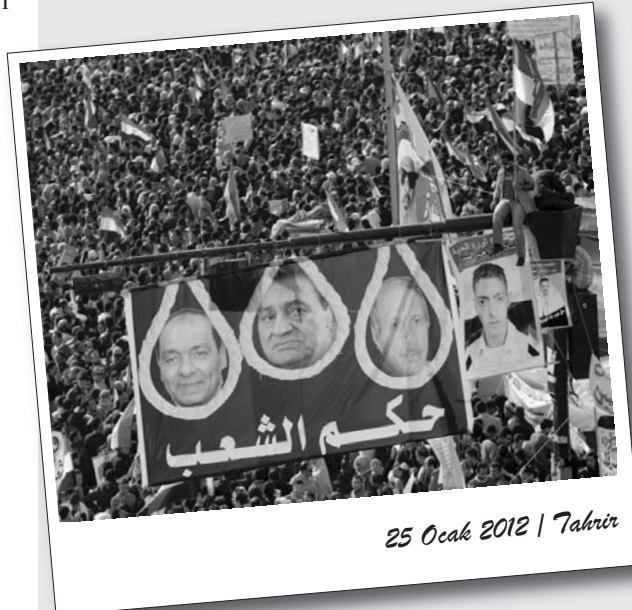
25 Ocak 2012 | Tahrir

Mübarek’ten sonra ilk defa “özgür-demokratik bir seçim” yapıldığını iddia eden dinci-gerici partiler ise kutlamalara sessizce katıldılar.